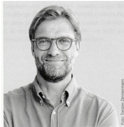
Jürgen Klopp, Fußballtrainer, ist ehrenamtlicher Botschafter der evangelischen Kirche für das Reformationsjubiläum 2017.

„Der liebende Gott, an den ich glaube, bei dem sind alle willkommen, ungeachtet ihrer Hautfarbe, ihrer Herkunft und ihrer Bildung.“